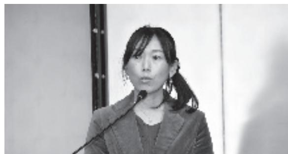
衆議院議員 松原 仁 様 経済産業省製造産業局 素材産業課