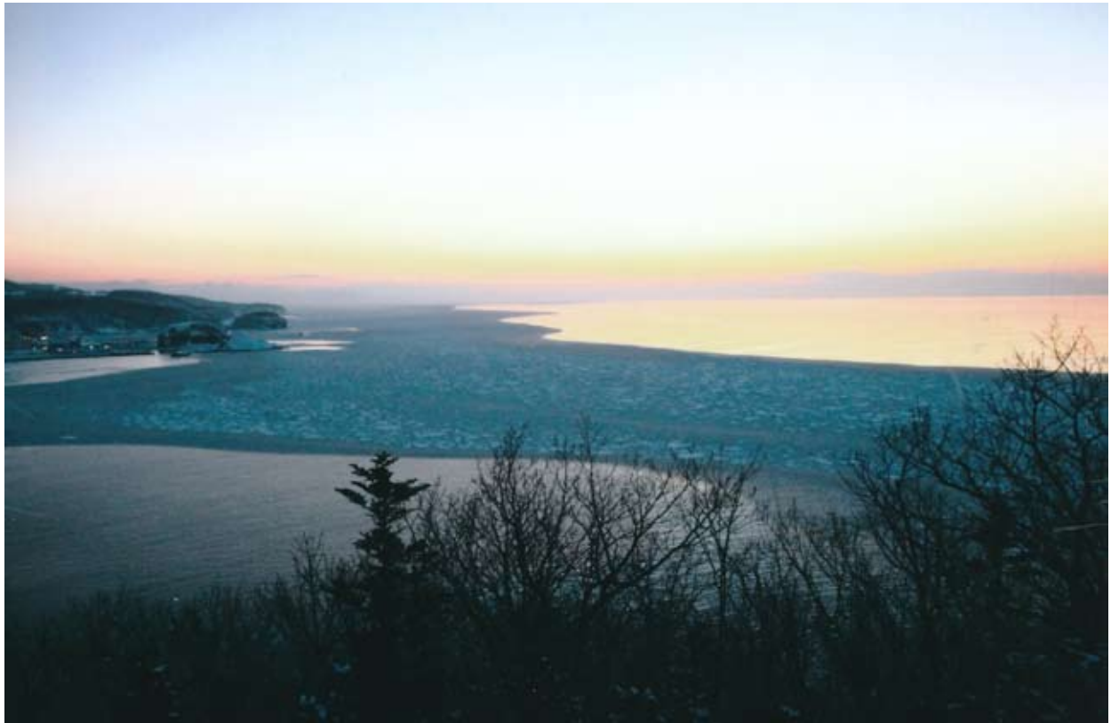
知床半島・斜里町ウトロの海岸で19日の朝、流氷が確認された。

発行所 東京都製紙原料協同組合 台東区台東3-16-1 TEL (3831) 7980 発行人 近藤 勝 編集広報委員会