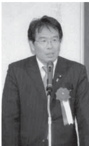
衆議院議員 当組合名誉顧問 松原 仁 様

衆議院議員であり当組合名誉顧問でもある松原仁様が公務多忙の中、時間をさいてかけて来てくださり、通常総会で挨拶されました。